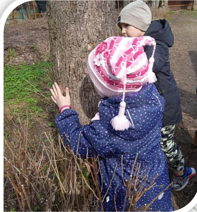
Темная кора нагрелась сильнее