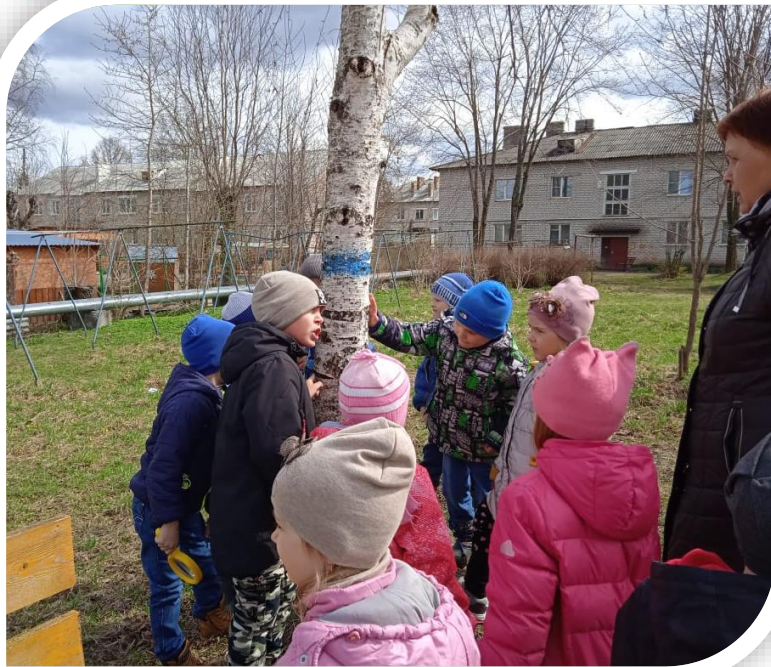
Светлая кора нагрелась меньше