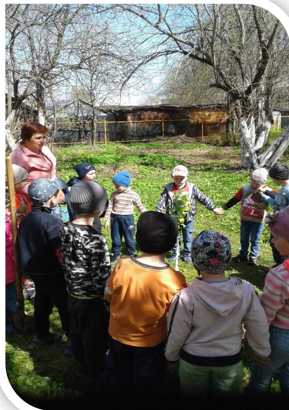
Яблоньку посадили. Деревья побелили