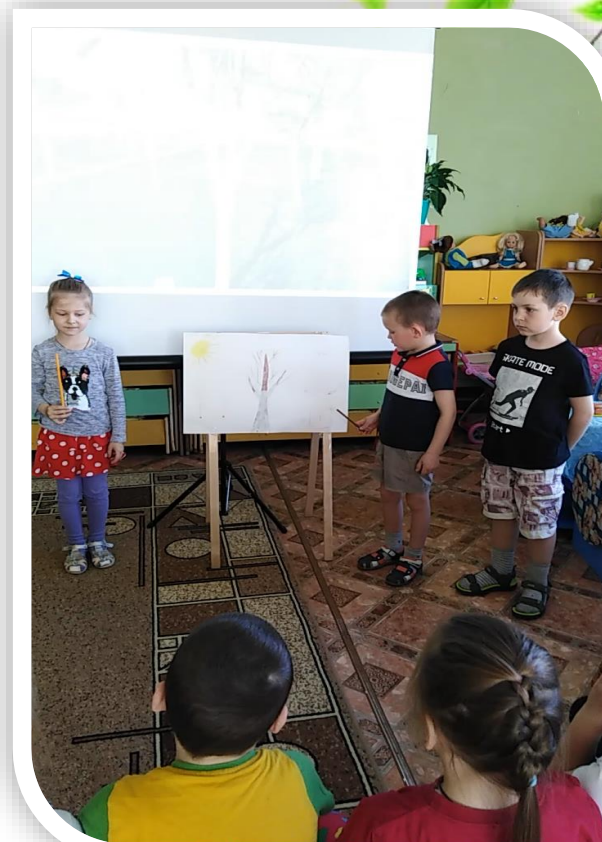
Рассказали детям зачем белят деревья